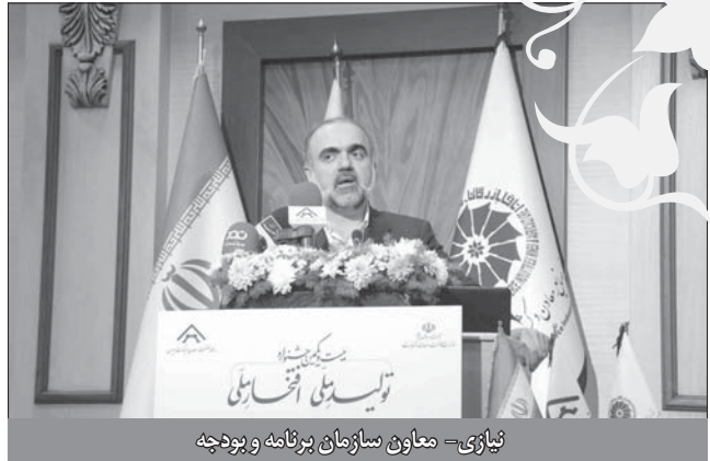
نیازی - معاون سازمان برنامه و بودجه