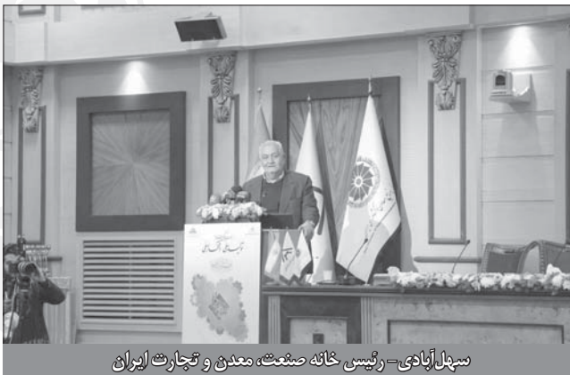
سهراب آبهایی - رئیس هیئت صنعت، معدن و تجارت ایران