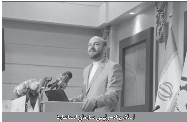
اسلام پناه - رئیس سازمان استاندارد

رونق تولید به صورت مستقیم در بهبود وضعیت اقتصادی جامعه اثر گذار است.